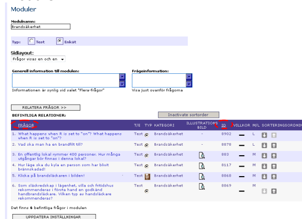
Du kan enkelt sortera dina frågor i en modul.

först ha "aktiverat sorteringsordning" i modulen.