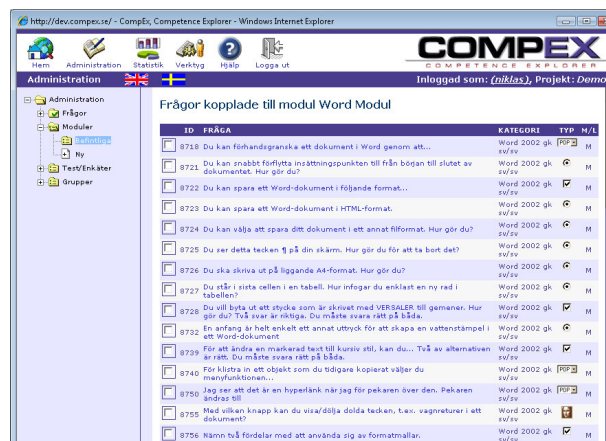
Tydligare vy när du väljer frågor i din modul.

När man ska koppla frågor till en modul blir det nu en tydligare vy där du kan se mer detaljer om frågorna samt att du kan sortera frågorna i presentationsvyn.